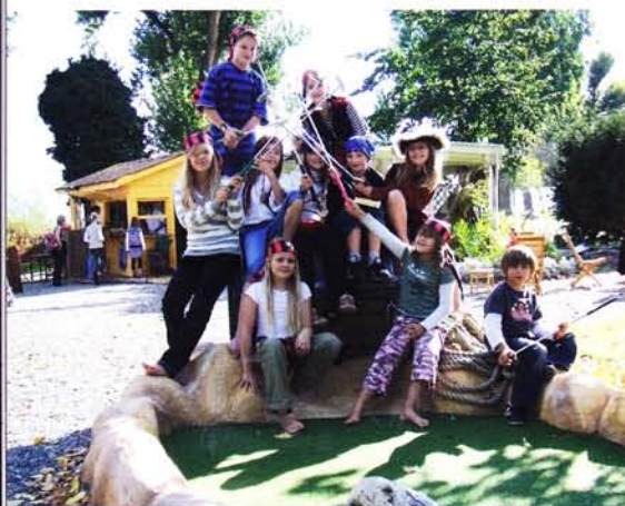
Miniatur- & Adventure Golf – Mehr als ein Comeback! 62