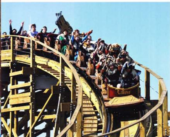
„Wodan Timburcoaster“ im Europa-Park 14

AquaMagis erweitert sein Freizeitangebot