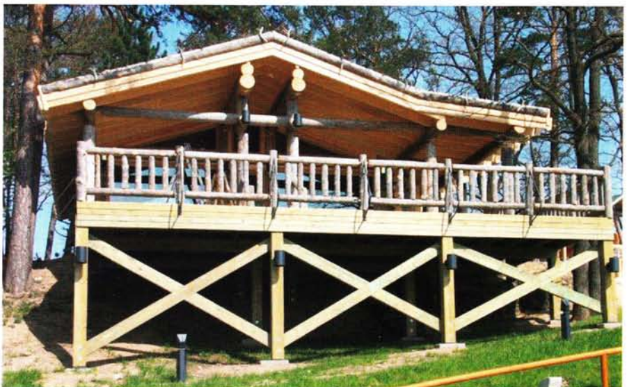
Die neue Baumhaus-Sauna mit Aufgüssen in einer Höhe von 2,70 Metern ist bereits in Betrieb.