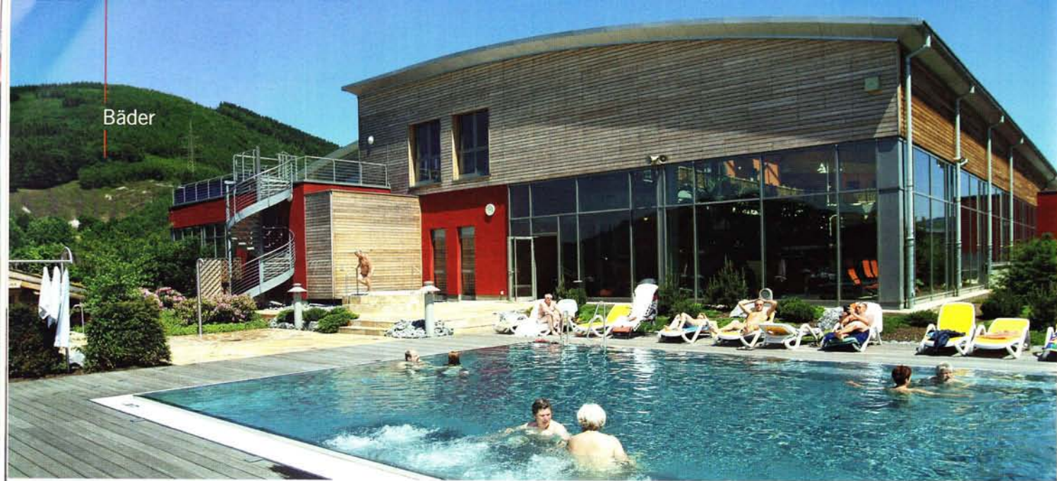
Südwestfalens AquaMagis in Plettenberg hält auch 2012 Neuheiten für seine Gäste bereit.