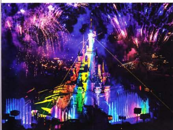
20 Jahre Disneyland Paris 26